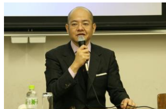
岩崎 夏海 氏 (小説家)