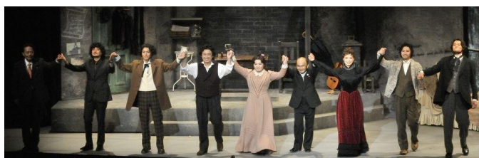
『ラ・ボエーム』カーテンコール