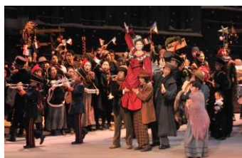
『ラ・ボエーム』第2幕

また、本年度は本学創立105周年にあたることから、教員、学生の主体的活動により、平成24年9月23日に、創立105周年記念オペラ『ラ・ボエーム』を本学100周年記念ホールで公演し、大変な高評を博した。