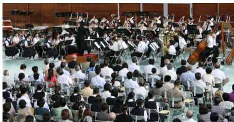
信濃町小中学校吹奏楽部との合同演奏

また長野県信濃町、信濃町森林療法研究会「ひとときの会」との連携協定（平成24年2月22日）に基づき、シンフォニーオーケストラの合宿を行う傍ら、学生達は黒姫山麓の癒しの森を体感した。合宿の最終日には、信濃町小中学校吹奏楽部も参加して、オーケストラによるコンサートを行った。