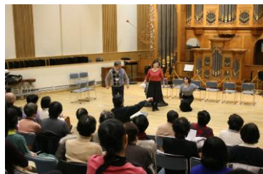
としまコミュニティ大学 レッスン風景