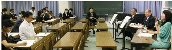
エンロールメント・マネジメント講座

③ 学生相談室をはじめ医務室、学生支援課等において日頃の悩みや問題を訴える学生が年々増加している。平成24年度に学生相談室に来た学生は、67人で、延べ354件の面接を行った。