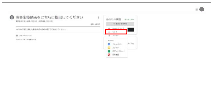
「あなたの課題」▶「追加または作成」(パソコン)