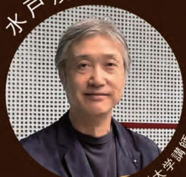
東京音楽大学講師