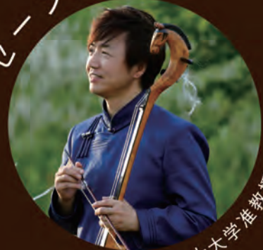
東京富士大学准教授