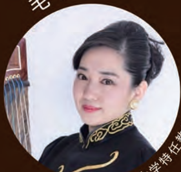
東京音楽大学特任教授