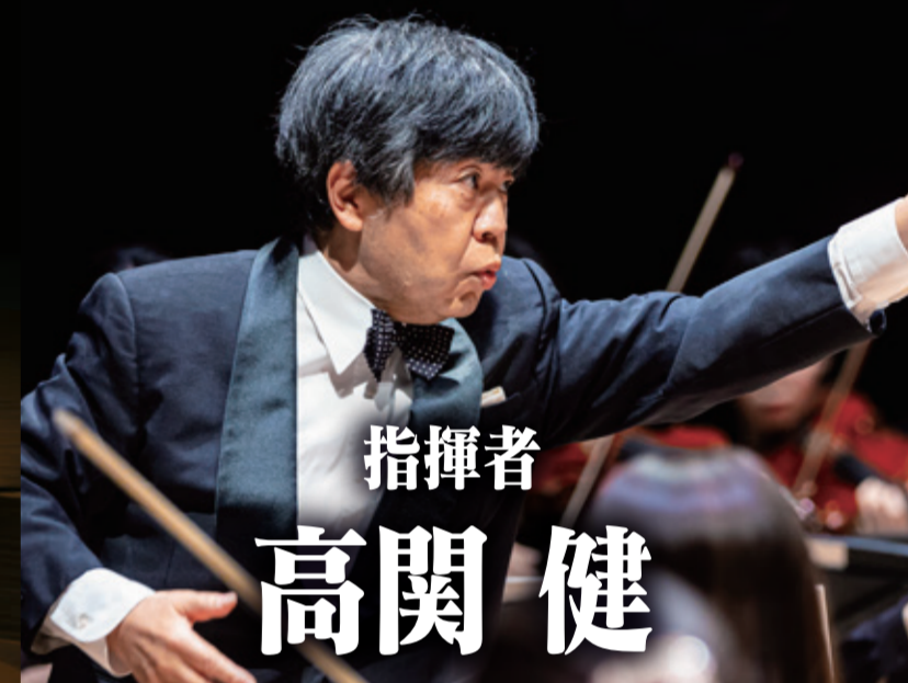
指揮者 高関 健