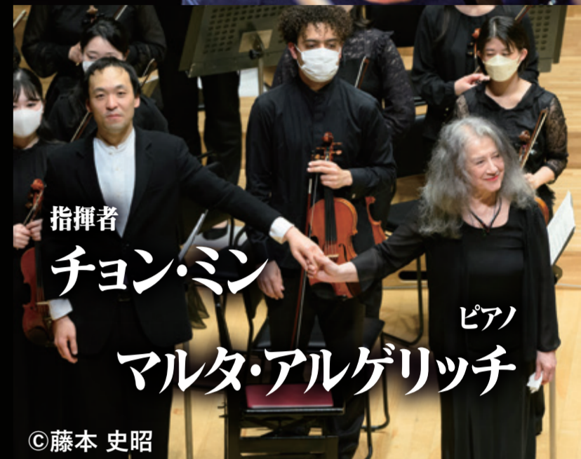
指揮者 チョン・ミン ピアノ マルタ・アルゲリッチ