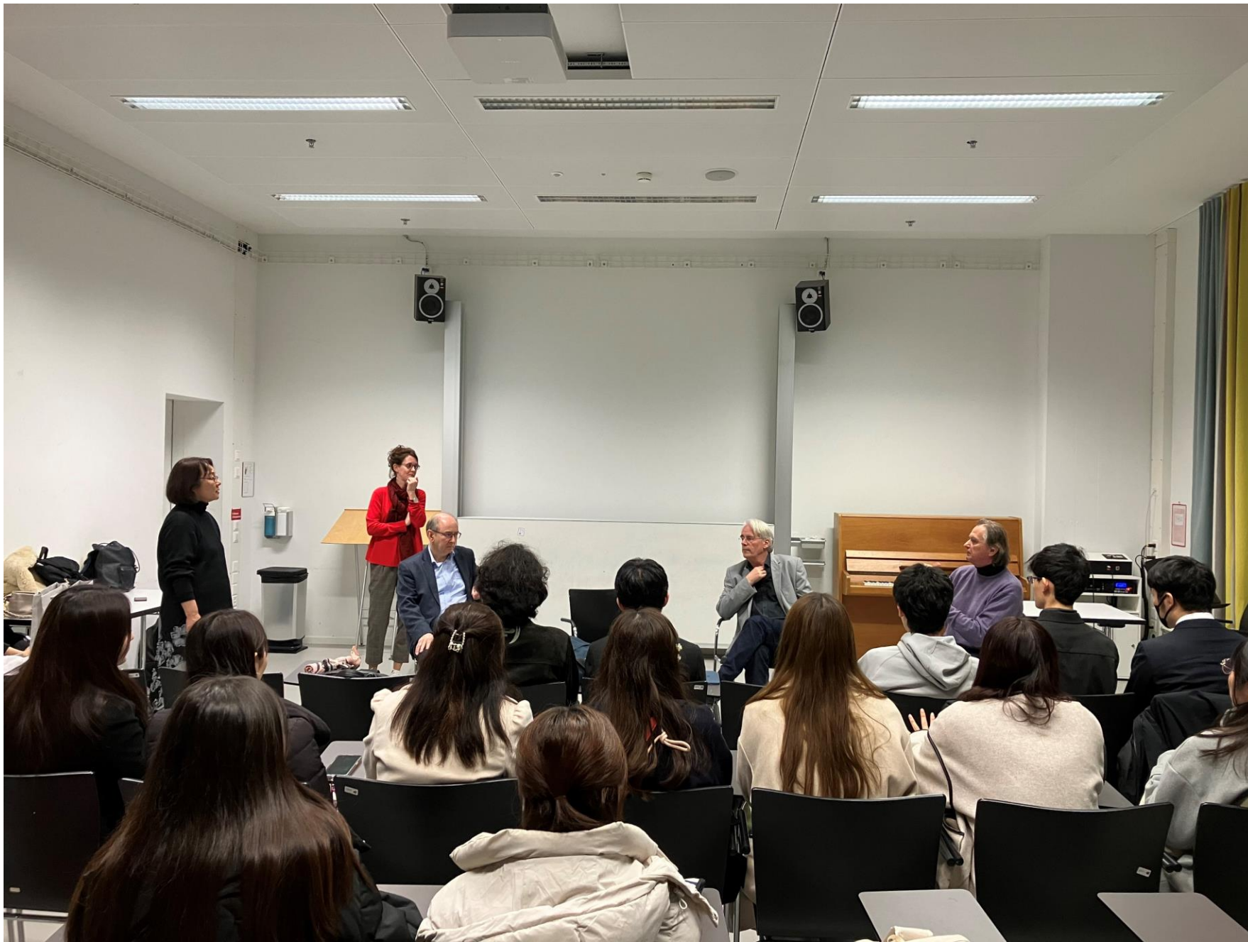
Guidance at ZHdK