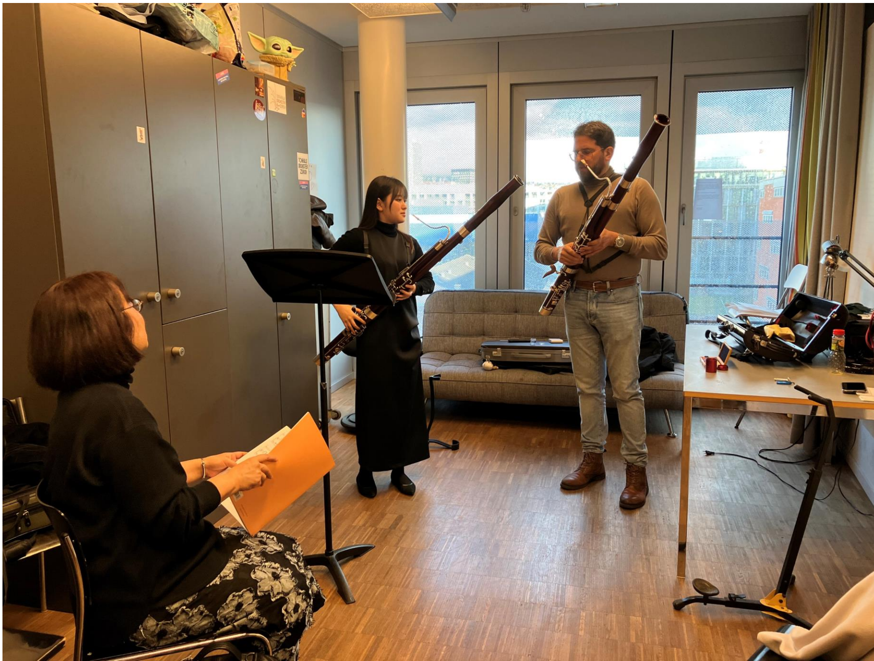
Bassoon lesson at ZHdK