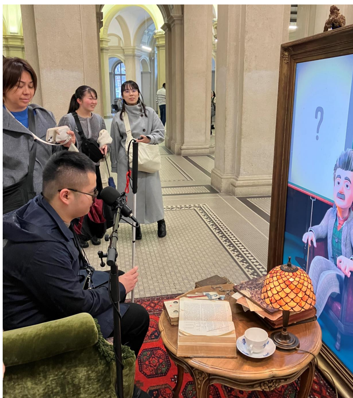
Had a conversation with Einstein at his alma mater Swiss Federal Institute of Technology in Zurich