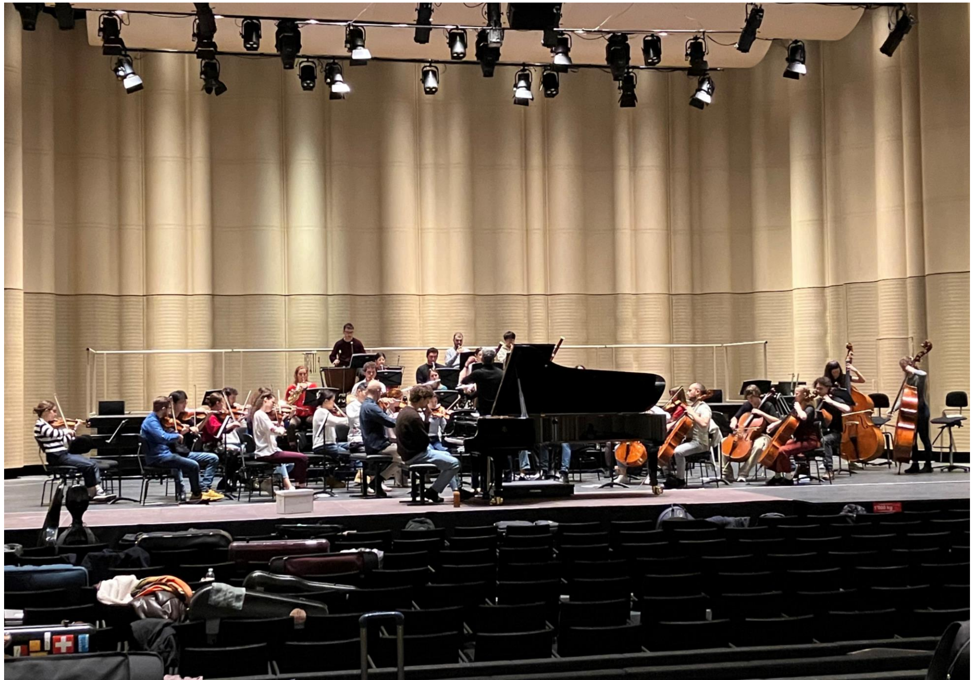
Rehearsal of the Beethoven Project (piano concerto)