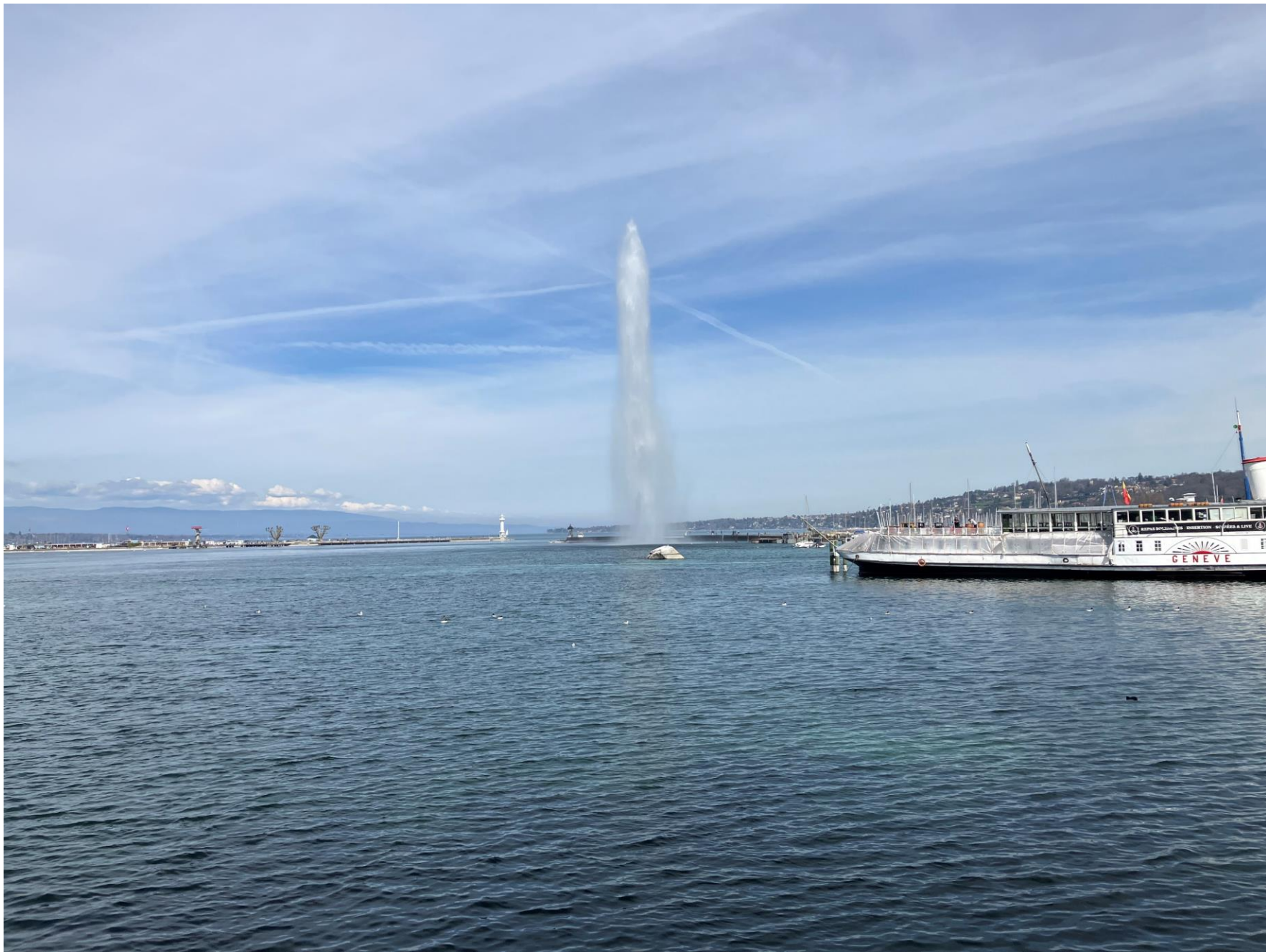
Jet d'Eau (large fountain) in Geneva