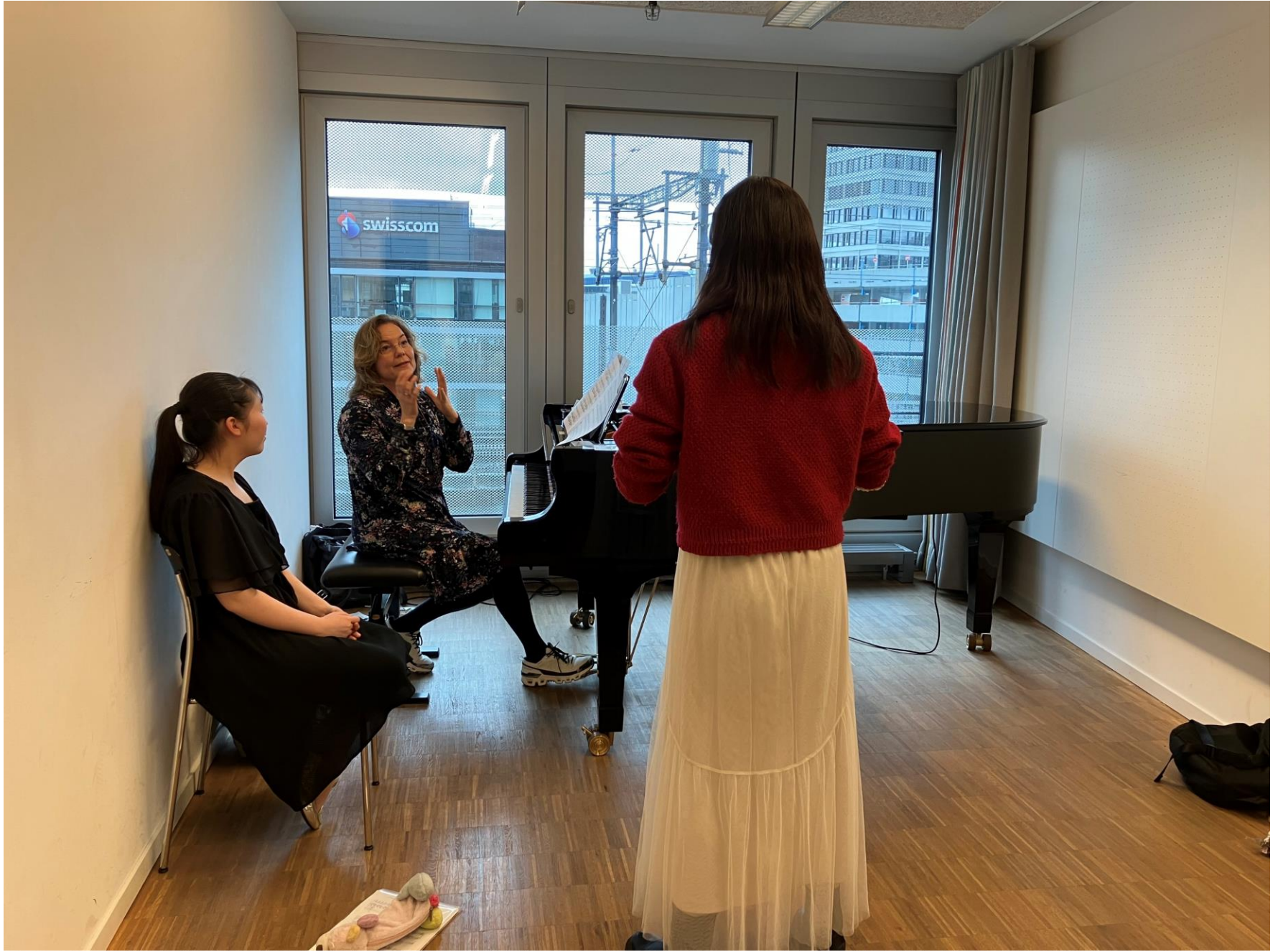
Voice lesson at ZHdK