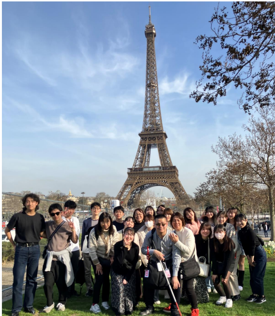
The Eiffel Tower in Paris