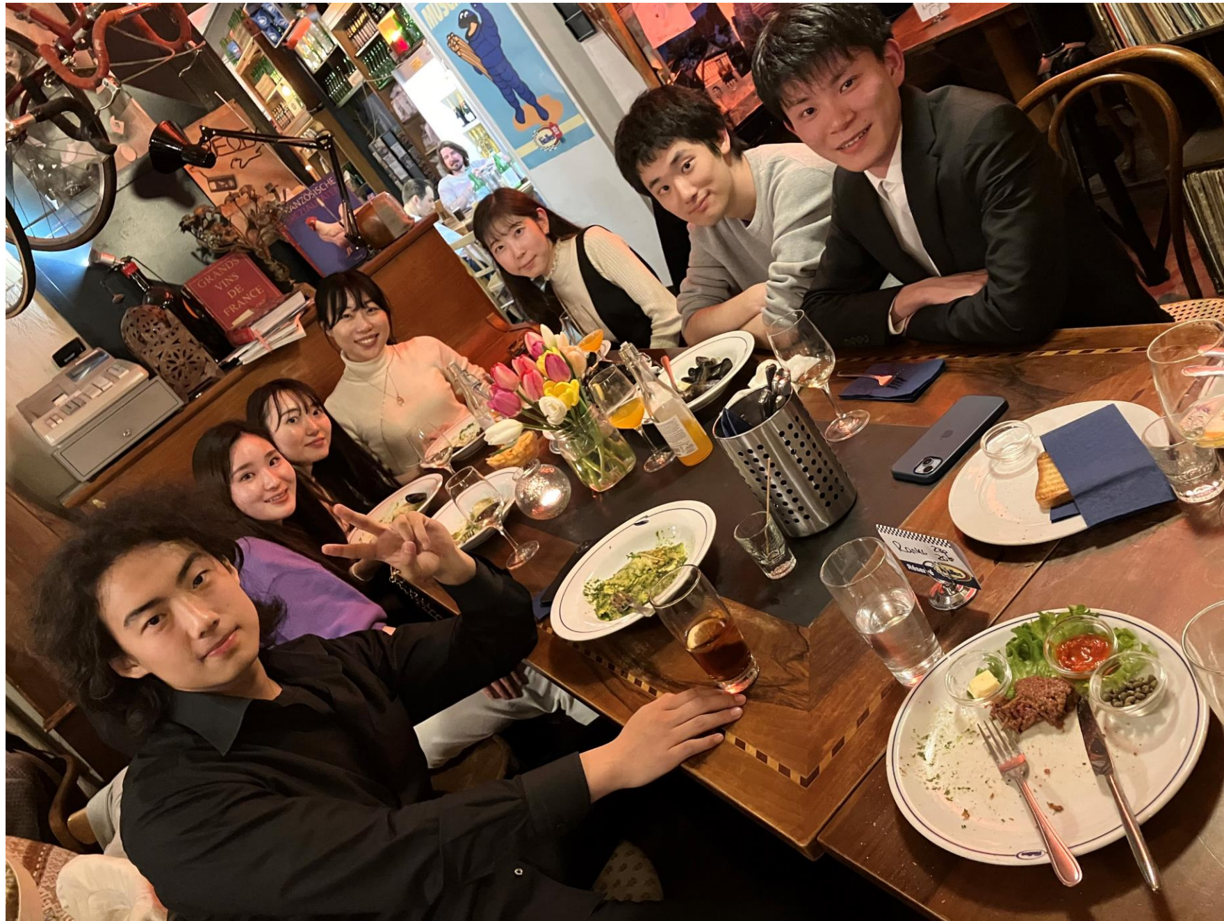
Dinner after the concert