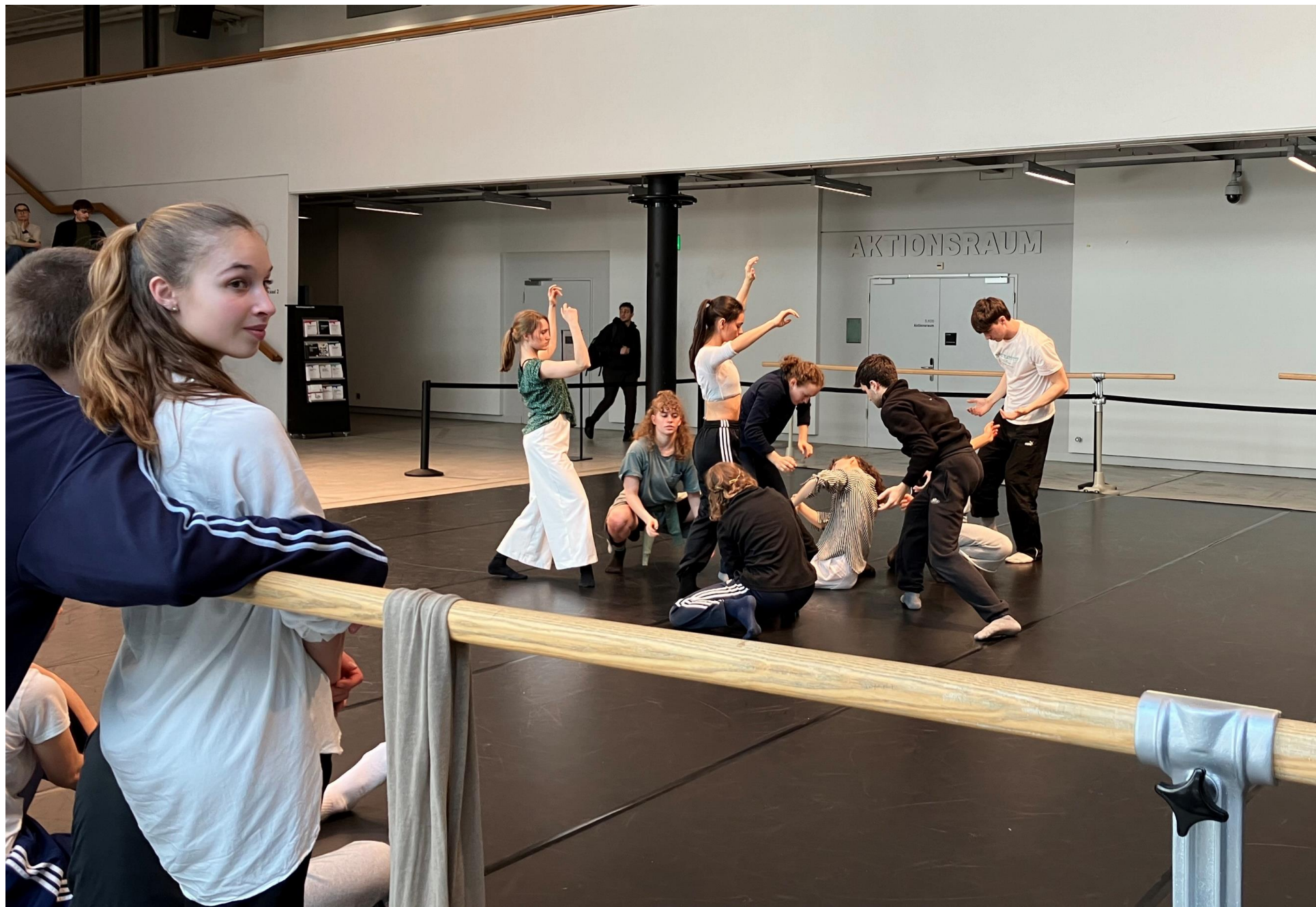
Performance by ZHdK dance students