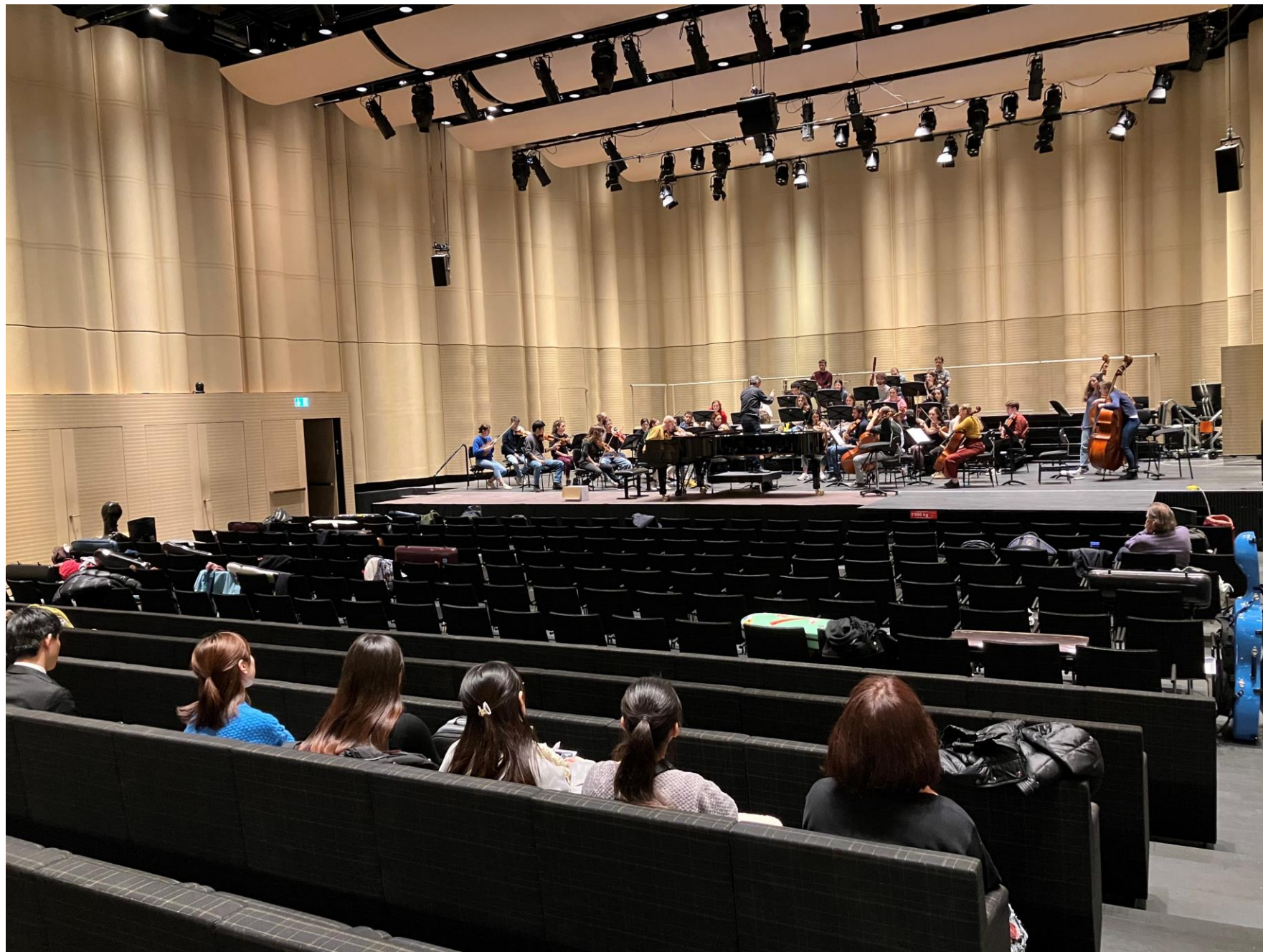
Rehearsal of the Beethoven Project