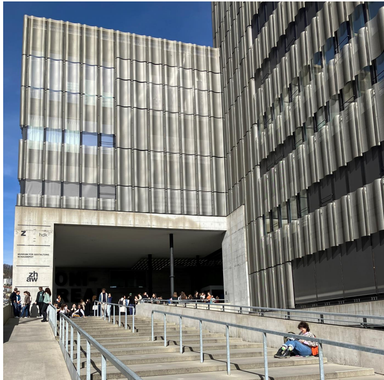
Our partner Zurich University of the Arts (ZHdK)