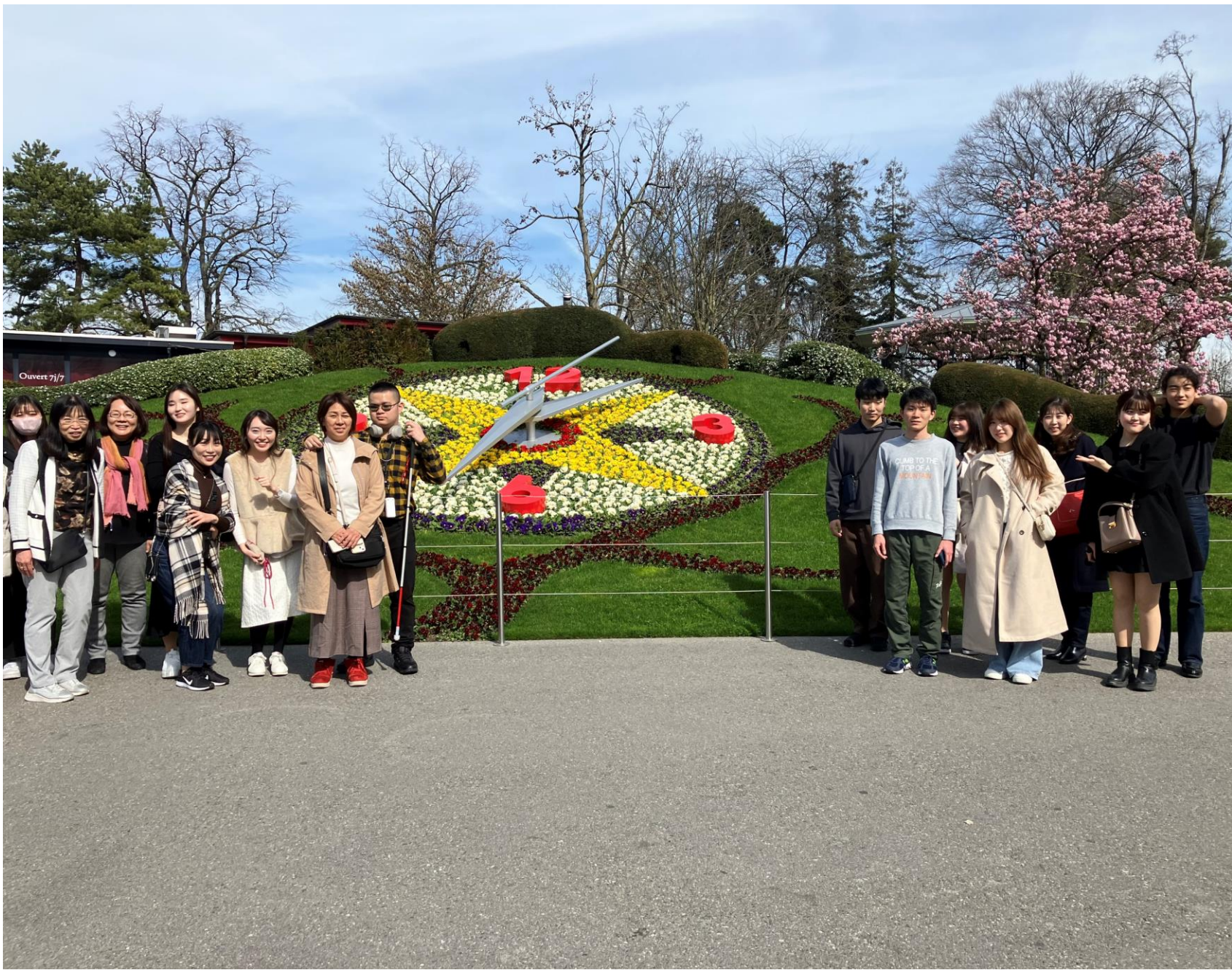
L'horloge fleurie (flower clock) in Jardin Anglais Park