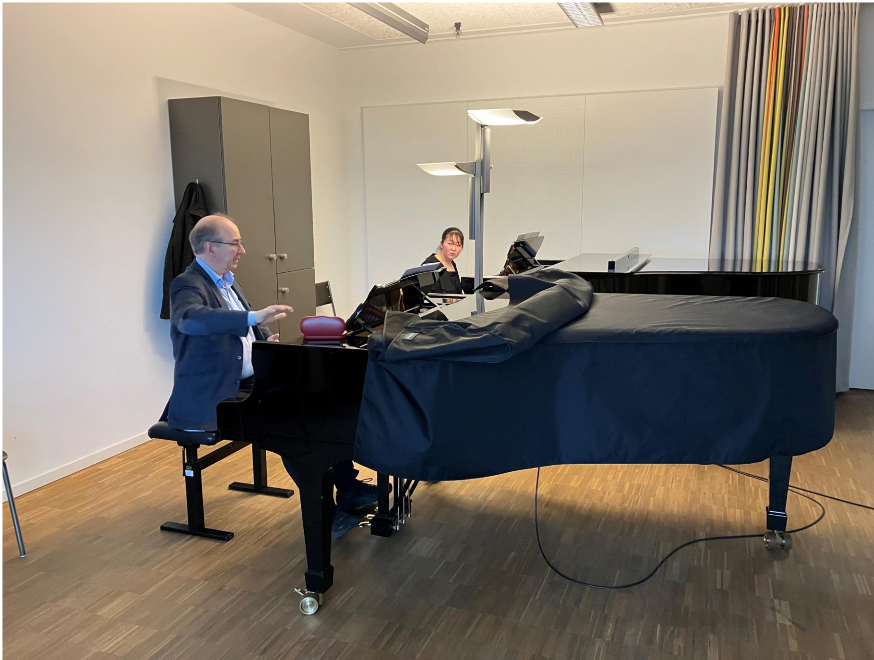
Piano lesson at ZHdK