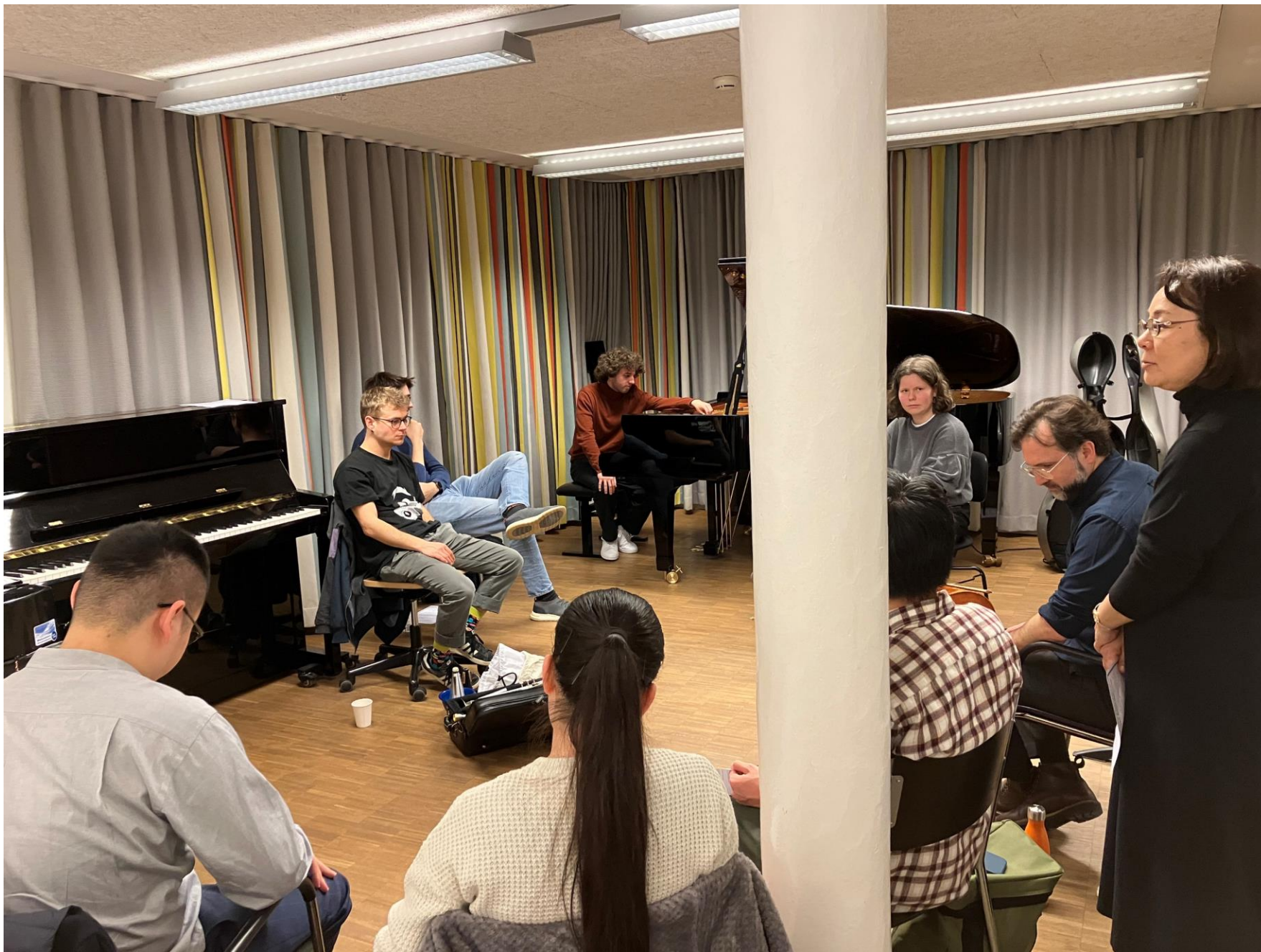
Improvisation workshop at ZHdK