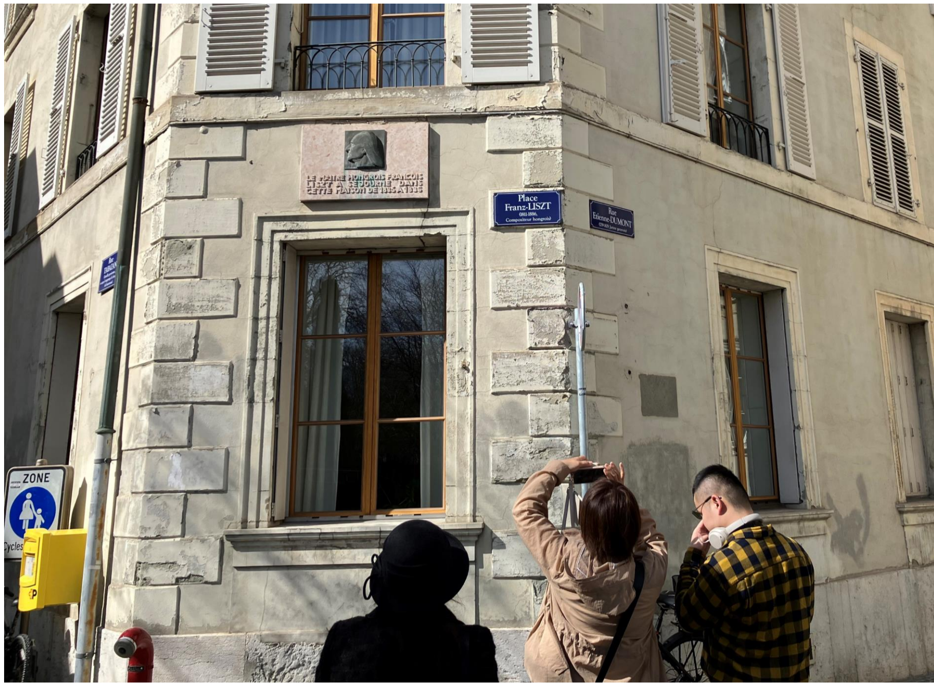
Franz Liszt's house in Geneva