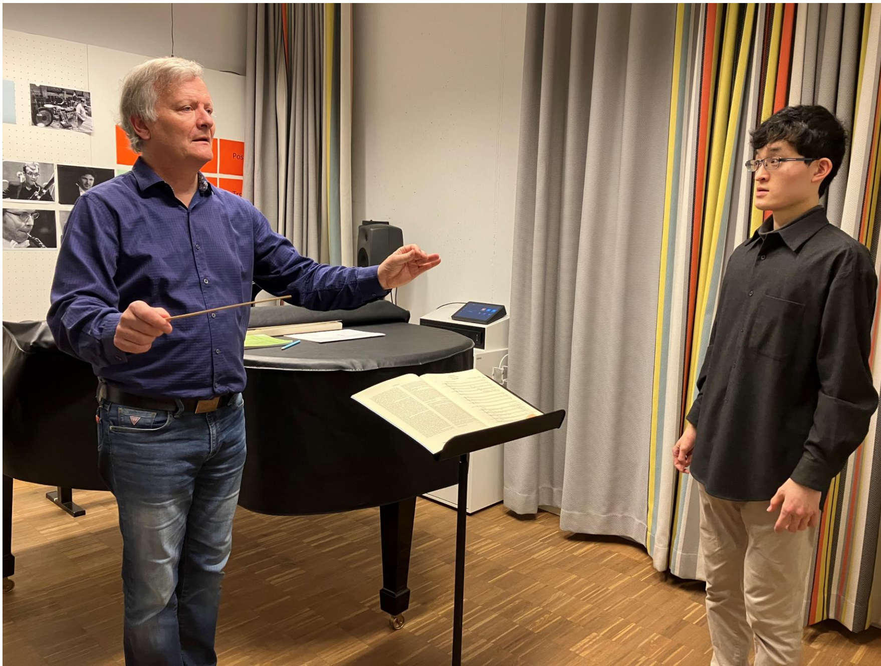
Conducting lesson at ZHdK