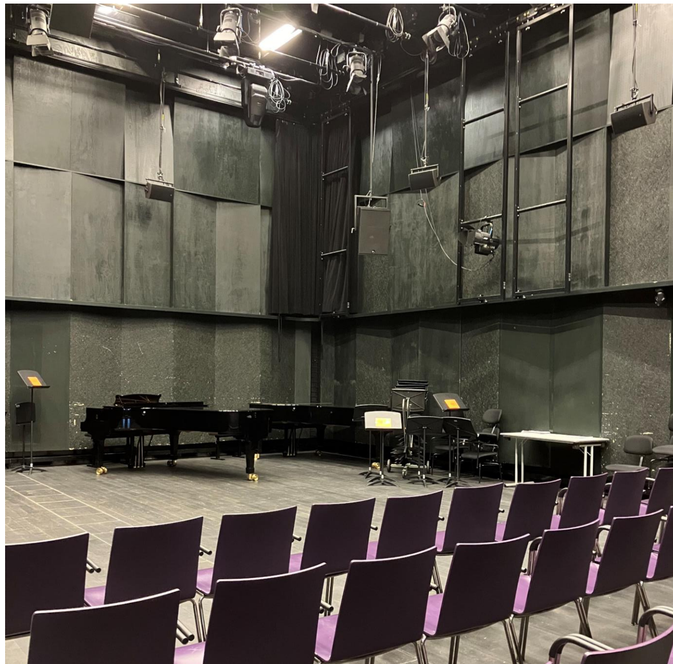
ZHdK medium-size concert hall