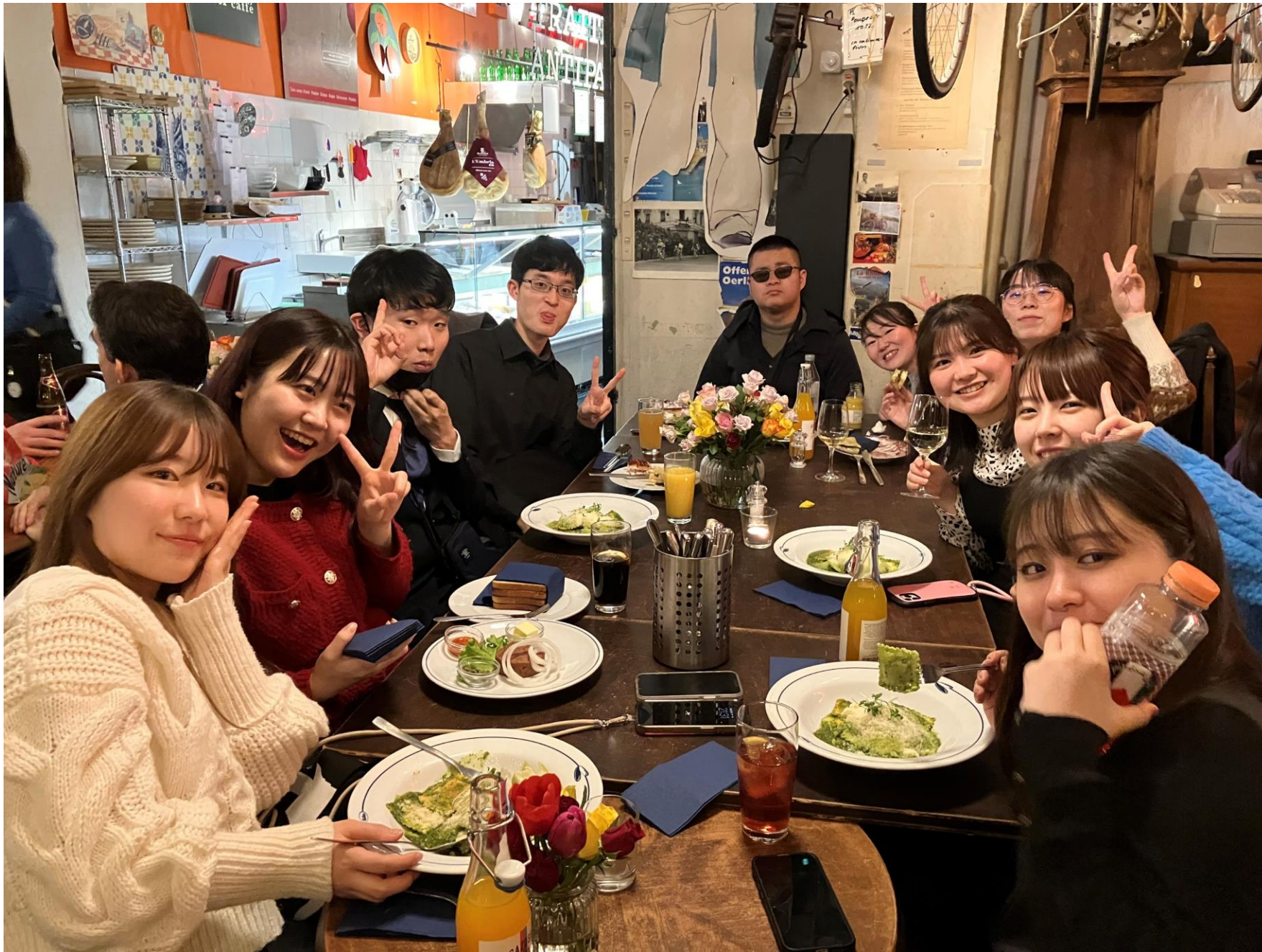
Dinner after the concert